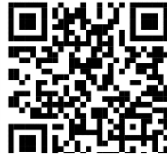
QR code ๑

๓๐ กรกฎาคม ๒๕๖๗ ปรากฏตาม QR code ๑ : ประกาศสำนักงาน ป.ป.ช. เรื่อง ผลการประเมิน ITA ๒๕๖๗ และ QR code ๒ : ข่าวประชาสัมพันธ์ ป.ป.ช. ประกาศผล ITA ๒๕๖๗ โดยในส่วนของ การประเมินคุณธรรมและความโปร่งใส ในการดำเนินงานของหน่วยงานภาครัฐ (ITA) ประจำปีงบประมาณ พ.ศ. ๒๕๖๗ ของจังหวัดเชียงใหม่